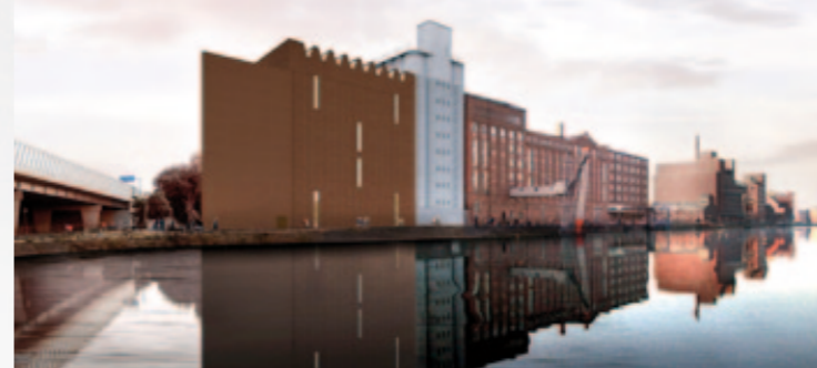
MKM Erweiterungsbau, Perspektive Innenhafen (Simulation) © Herzog & de Meuron

Till Brönner (*1971, Viersen) ist überzeugter Kosmopolit. Er lebt in Berlin und Los Angeles und ist als Musiker weltweit auf Tournee. Seit zehn Jahren ist Brönner auch erfolgreich als Fotograf tätig. Sein Bildband „Faces of Talent“ (teNeues) mit einfühlsamen Porträts von Musikerkollegen und anderen prominenten Persönlichkeiten brachte ihm 2015 erhebliches mediales Interesse ein. Mit seinem jüngsten Projekt Melting Pott für das Museum Küppersmühle erweitert er seinen Blickwinkel noch einmal um ganz neue Perspektiven. Die Ausstellung zeigt und porträtiert mit dem Rhein-Ruhr-Gebiet eine gesamte Region.